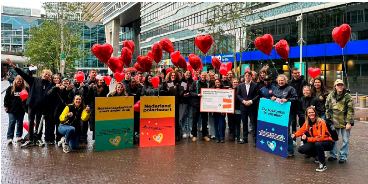
^ Jongeren laten Den Haag zien hoeveel waarde zij aan Maatschappelijke Diensttijd hechten.

MDT is een programma van het ministerie van OCW, in samenwerking met jongeren, maatschappelijke organisaties, scholen, gemeenten en andere ministeries. MDT biedt jongeren tussen de 12 en 30 jaar de kans om hun talenten te ontwikkelen, mensen te ontmoeten buiten hun leefwereld en iets te doen voor een ander en/of de samenleving. NOV draagt graag aan MDT bij, omdat wij zien dat MDT veel jongeren de kans biedt zich vrijwillig in te zetten voor een ander en op die manier kennis te maken met het vrijwilligersveld. MDT bereikt ook jongeren die normaal gesproken geen vrijwilligerswerk zouden doen. MDT draagt bij aan verjonging van vrijwilligersbestanden van maatschappelijke organisaties en het enthousiasmeren van jongeren zich vrijwillig in te zetten voor de samenleving.